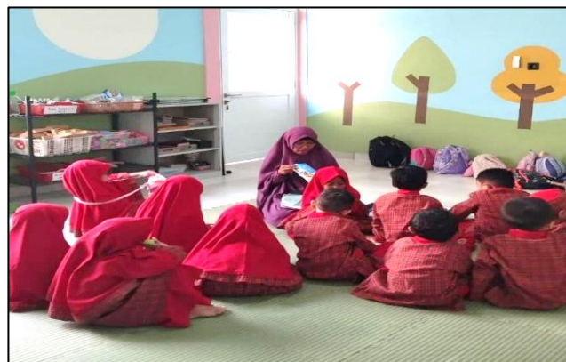
Gambar 1. Kegiatan Bercerita

Hasil penelitian menunjukkan bahwa buku cerita dimanfaatkan secara sistematis dan berkelanjutan sebagai media pengembangan bahasa anak usia dini di TK Qolbu Ilmi Islamic School. Berdasarkan observasi lapangan, kegiatan membaca dan bercerita menggunakan buku cerita telah terintegrasi dalam rutinitas pembelajaran harian anak, baik pada kegiatan awal, inti, maupun penutup pembelajaran. Buku cerita tidak diperlakukan sebagai media tambahan semata, melainkan sebagai sarana utama untuk menstimulasi kemampuan bahasa anak secara alami dan kontekstual.