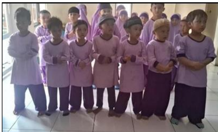
Gambar 1. Praktek Ibadah

Pelaksanaan salat berjamaah juga memberikan pengalaman konkret kepada anak tentang pentingnya mengikuti aturan dan urutan. Anak diajarkan untuk mengikuti gerakan salat secara berurutan, menjaga posisi dalam barisan, serta menyesuaikan gerakan dengan imam. Dari hasil observasi, terlihat bahwa anak-anak berusaha meniru gerakan guru dengan sungguh-sungguh, meskipun belum sepenuhnya sempurna. Proses ini menunjukkan bahwa kegiatan ibadah berfungsi sebagai sarana pembelajaran disiplin yang bersifat langsung dan bermakna bagi anak usia dini.