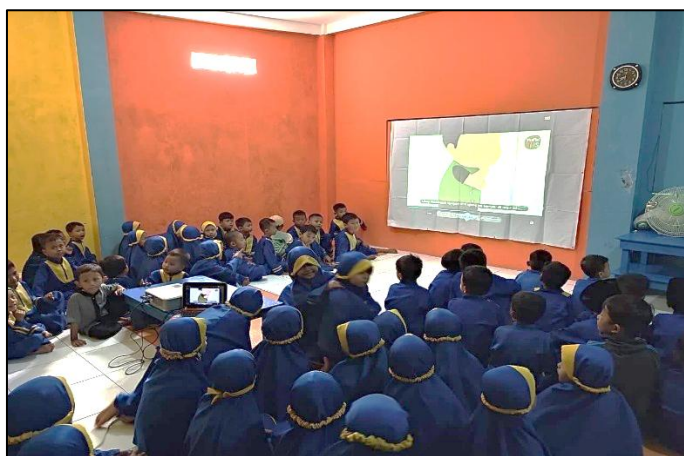
Gambar 1. Pembelajaran Praktek Wudhu Menggunakan Video

Pelaksanaan pembelajaran diawali dengan kegiatan apersepsi, di mana guru mengondisikan anak untuk duduk dengan rapi dan menjelaskan secara singkat materi ibadah yang akan dipelajari. Guru kemudian memutar video pembelajaran dan meminta anak untuk memperhatikan tayangan dengan saksama. Berdasarkan hasil observasi, anak menunjukkan minat yang tinggi ketika video diputar. Anak tampak fokus memperhatikan layar, mengikuti gerakan yang ditampilkan, dan sesekali menirukan bacaan yang terdengar dari video. Hal ini menunjukkan bahwa media audio-visual mampu menarik perhatian anak dan menciptakan suasana belajar yang lebih kondusif.