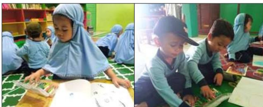
Gambar 1. Kegiatan Jurnal Anak

Pelaksanaan kegiatan jurnal diawali dengan pengondisian kelas oleh guru, seperti mengajak anak duduk melingkar dan menjelaskan secara singkat bahwa mereka akan menggambar dan bercerita. Guru menekankan bahwa tidak ada gambar yang benar atau salah, sehingga anak bebas menuangkan ide mereka. Berdasarkan hasil observasi, pendekatan ini membuat anak terlihat antusias dan langsung mulai menggambar tanpa rasa ragu. Anak yang biasanya pasif dalam kegiatan belajar menunjukkan ketertarikan ketika diberi kesempatan menggambar secara bebas.